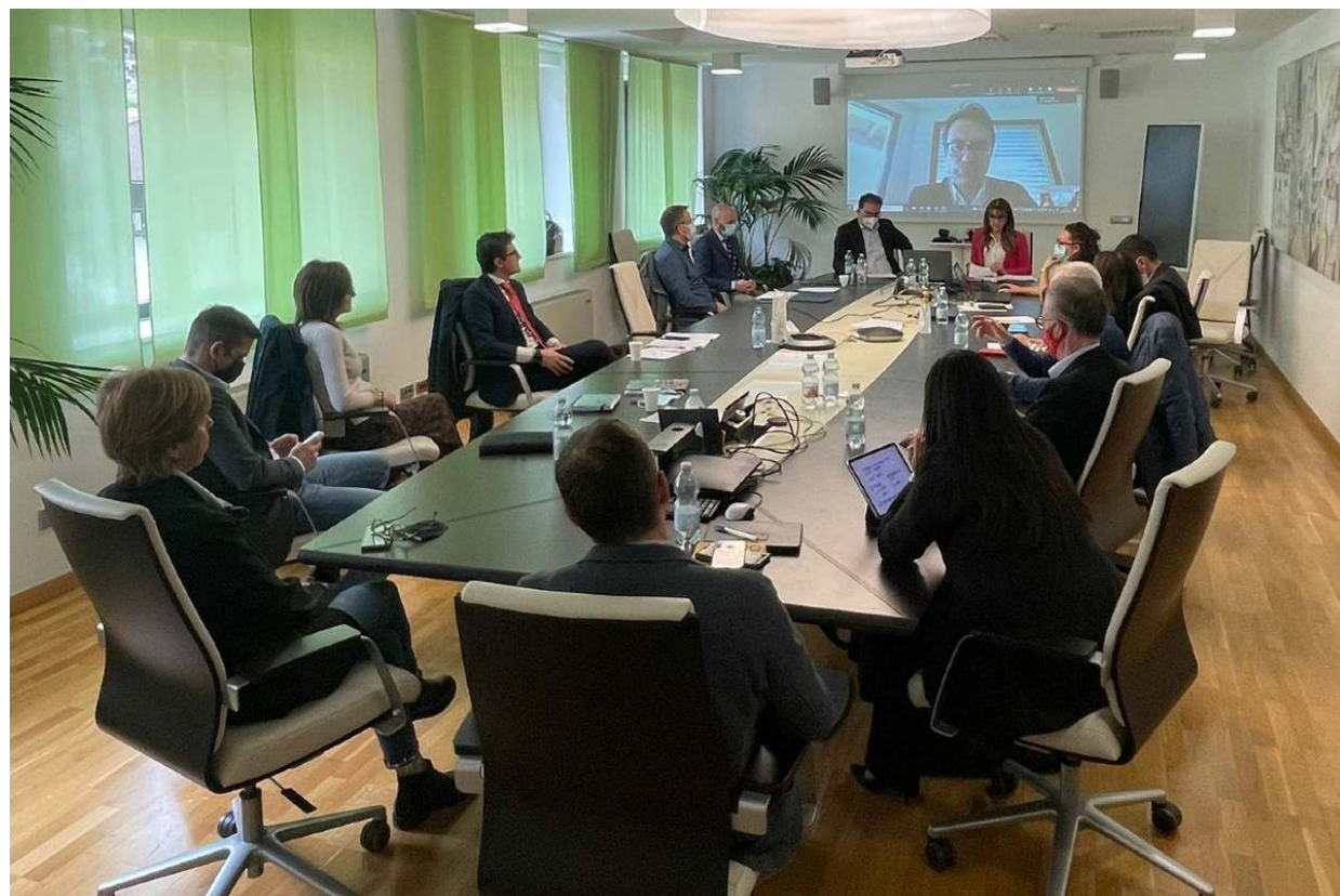
L'assemblea dei soci de La Cassa Rurale.

Nata nel 2020 dalla fusione Adamello-Giudicarie, la nuova Cassa Rurale ha un nome lungo che racchiude le comunità del territorio che rappresenta, che parte da Madonna di Campiglio e arriva fino a Salò ed è presidiato da 39 filiali in cui operano 257 dipendenti . Sono invece 17mila i soci e 60mila i clienti.