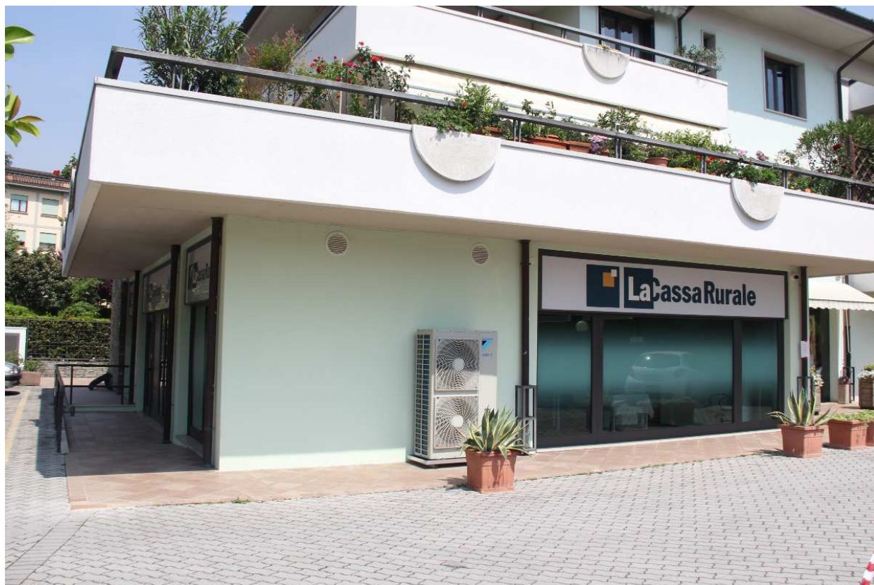
La nuova filiale di salò, che aprirà al pubblico a fine maggio.